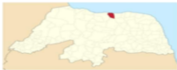
Localização de Guamaré no Rio Grande do Norte