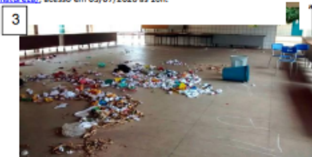
http://x1.globo.com/rn/rio-grande-do-norte/noticia/2014/11/alvo-de-ameacas-diretora-suspende-aulas-apos-escola-do-rn-ser-invasida.html , acesso em 03/07/2020 as 17 horas.