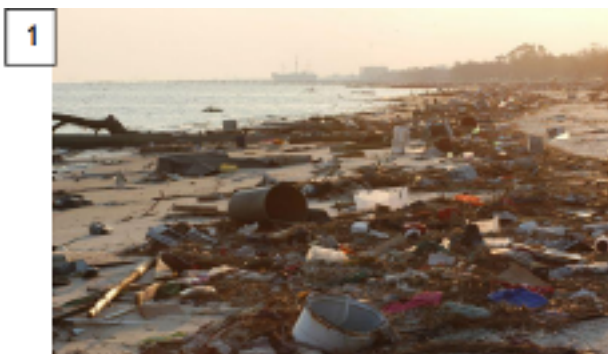
https://ricardoizar.com.br/noticias/meio-ambiente/lixo-na-naturaleza/ , acesso em 03/07/2020 as 16h.

E o que faremos para contribuir com a diminuição da produção diária de lixo doméstico? Um bom início é o consumo consciente!