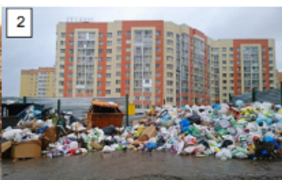
https://www.pensamentoverde.com.br/meio-ambiente/5-solucoes-para-o-problema-do-lixo-nas-grandes-cidades/ , acesso em 03/07/2020 as 16h30m.