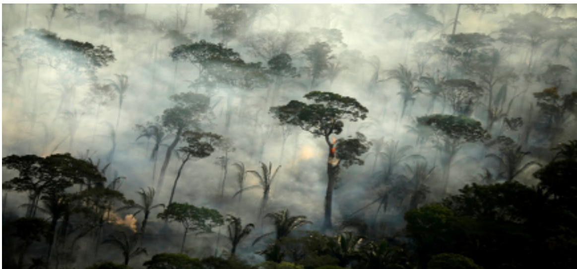
Fumaça sobe durante incêndio em uma área da floresta amazônica perto de Porto Velho (RO) em 10 de setembro de 2019

Entre janeiro e junho foram 10.395 focos em todo o país, contra 8.821 no mesmo período do ano passado - um crescimento de 17,8%.