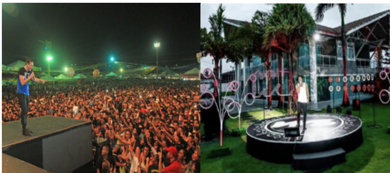
Figura 01: Wesley Safadão em show lotado com autos lucros (Antes da pandemia).