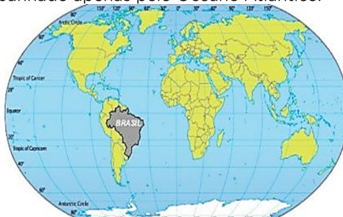
Localização do Brasil no Mundo

Do ponto de vista da localização, o Brasil situa-se no Continente Americano, mais precisamente na América do Sul. Localiza-se, também, em três hemisférios diferentes ao mesmo tempo: todo o seu território encontra-se no hemisfério ocidental (aquele que se localiza a oeste do Meridiano de Greenwich), a maior parte dele no Hemisfério sul (abaixo da Linha do Equador) e uma pequena parte no Hemisfério Norte. O seu território faz fronteira com todos os países sul-americanos, com exceção do Equador e do Chile. O litoral é banhado apenas pelo Oceano Atlântico.