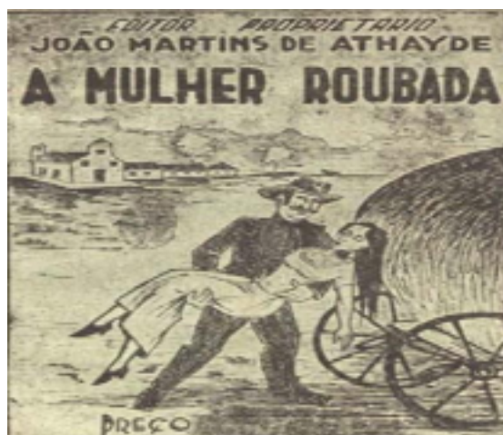
Figura 1: Literatura de Cordel A Mulher Roupada, de João Martins de Athaide.

Conteúdo adaptado do site: https://cejarj.cecierj.edu.br/img_ava/material_impresso.pdf