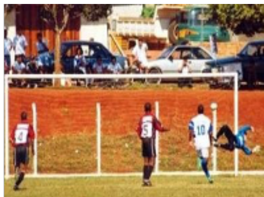
Figura 6: Futebol.

A cultura se constitui a partir do desenvolvimento da fala e da capacidade do homem de criar instrumentos de atuação sobre a natureza. Nesses dois pontos funda-se a característica humana da cultura. Foi o desenvolvimento da linguagem oral pelo homem que gerou potencialidades extraordinárias para a cultura. A primeira delas é a capacidade de o ser humano acumular conhecimento (de toda natureza), o que tem como consequência o avanço incessante da cultura.