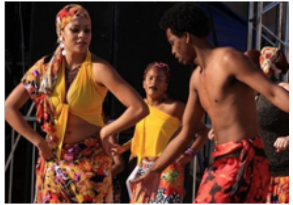
Figura 4: Dança Afro (Salvador-Bahia).