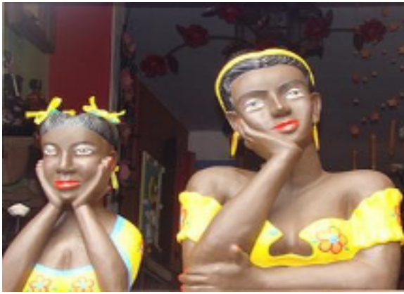
Figura 3: Namoradeiras – Artesanato (MG)