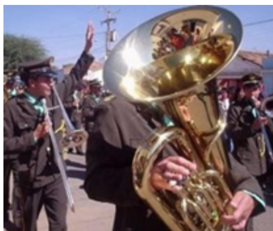
Figura 2: Música - Dia da Independência: 7 de Setembro - Brasil.