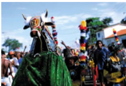
Bumba Meu boi

O carnaval é o evento popular mais famoso do Nordeste, especialmente em Salvador, Olinda e Recife. Também as festas juninas de Caruaru (PE) e Campina Grande (PB) se destacam. Os festejos de bumba meu boi são tradicionais em todos estados nordestinos.