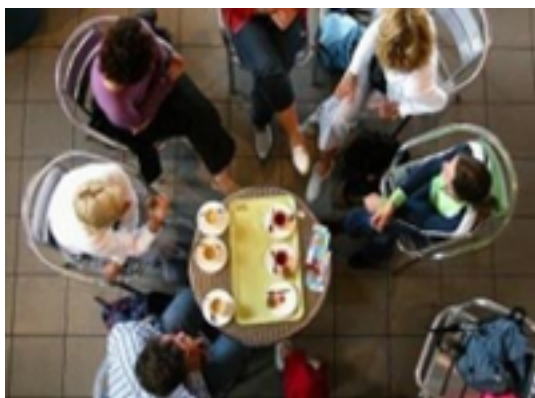
Figura 5: Cafezinho.

Para nós, no entanto, é importante abordar a cultura na perspectiva da Antropologia, ciência que estuda o homem a partir da análise de seus diversos modos de viver. A Antropologia amplia o conceito de cultura para além das manifestações. Para ela, a cultura se manifesta a todo o momento em nossas relações sociais e em nossa relação com o meio. Podemos, assim, ver traços culturais em várias situações e nas inúmeras relações que estabelecemos no nosso cotidiano. Observe algumas dessas situações ilustradas nas imagens a seguir: