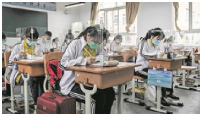
Imagem 1: Em volta às aulas na França, pré-escola desenhou quadros de giz no chão para manter isolamento entre as crianças em meio à pandemia de coronavírus. Imagem 2: Alunos de colégio em Wuhan com proteção individual de acrílico.

Que lições e medidas são perceptíveis ao observarmos as realidades apresentadas nas imagens? Será que estas medidas seriam aplicadas a sua realidade escolar? Justifique.