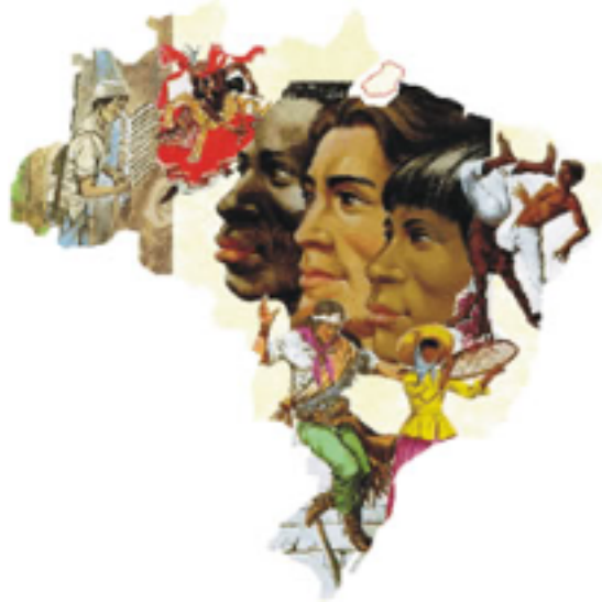
A pluralidade cultural no Brasil

Com base no conteúdo discutido até aqui, sobre Identidade Cultural Brasileira, e a partir da sua análise da imagem, construa um parágrafo dissertativo, no qual apresente, em sua opinião, como é formada a Identidade Cultural Brasileira.