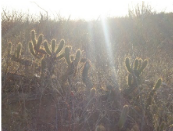
Típica paisagem do interior do Rio Grande do Norte

A hidrografia do Estado do Rio Grande do Norte é marcada pela temporariedade de seus rios, ou seja, rios que secam em um período do ano em decorrência do desprovimento de chuvas. No entanto, também existem rios de regime perene (que não secam) no agreste e no litoral. Dentre os rios que compõem a hidrografia, os principais são: Mossoró, Apodi, Assú, Piranhas, Potengi, Trairi, Jundiá, Jacu, Seridó e Curimatá.