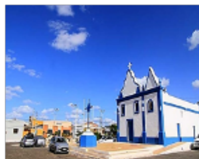
Igreja Santuário de Nossa Senhora da Conceição em Guamaré/RN