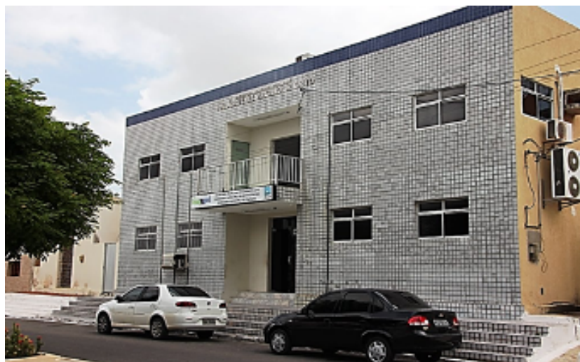
Atual prédio da Prefeitura de Guimarães.

Descreva quais foram as mudanças ocorridas na paisagem da antiga para atual Prefeitura de Guimarães.