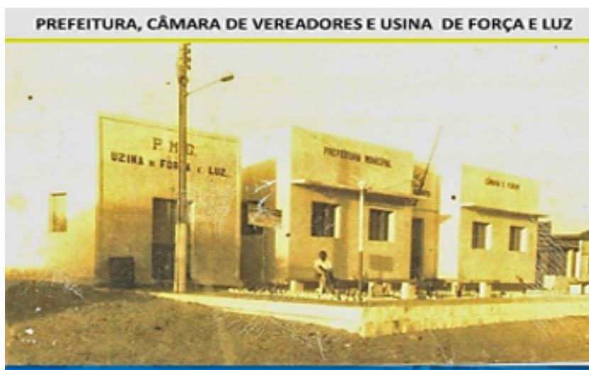
O antigo prédio da Prefeitura Municipal de Guimarães, ao lado direito a Câmara Municipal de Vereadores, ao lado esquerdo a usina de força de luz.

Observe as transformações que compõem a paisagem onde fica a prefeitura municipal de Guimarães/RN ao longo do tempo.