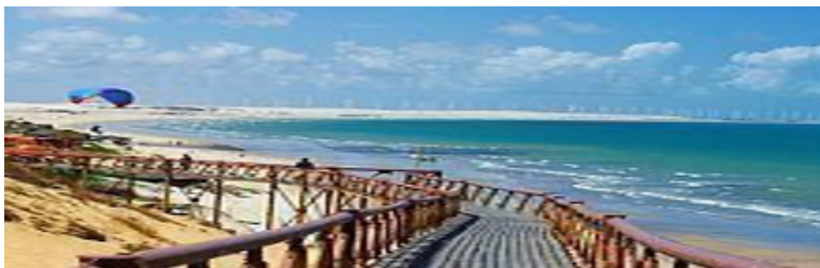
Geradores eólicos na Praia de Canoa Quebrada, em Aracati, Ceará.

Em 2017, diante dos níveis baixos dos reservatórios, a energia eólica passou a representar 50% da geração de energia elétrica na região, com destaque para os estados do Rio Grande do Norte, com 3.722 MW e 137 parques; Bahia, com 2.594 MW e 100 parques; Ceará, com 1.950 MW e 75 parques; Piauí, com 1.443 MW e 52 parques; Pernambuco, com 781 MW e 34 parques; Maranhão, com 220 MW e 8 parques; e Paraíba, com 157 MW e 15 parques.