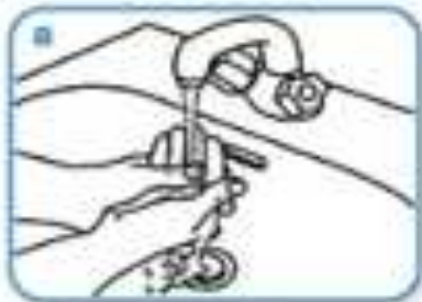
Rinse hands with water