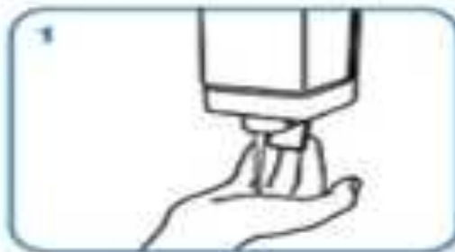
apply enough soap to cover all hand surfaces.