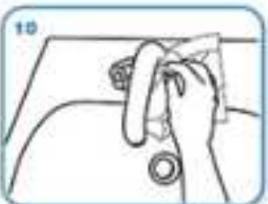
use towel to turn off faucet