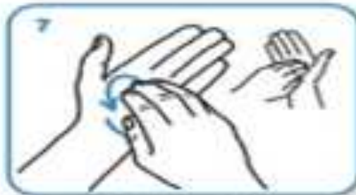
rotational rubbing, backwards and forwards with clasped fingers of right hand in left palm and vice versa.