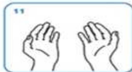
...and your hands are safe.