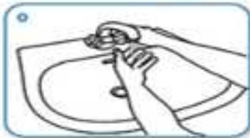
Wet hands with water

Duration of the entire procedure: 40-60 sec.