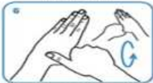
rotational rubbing of left thumb clasped in right palm and vice versa