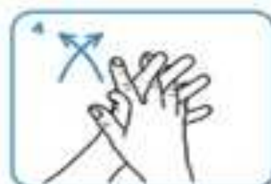
palm to palm with fingers