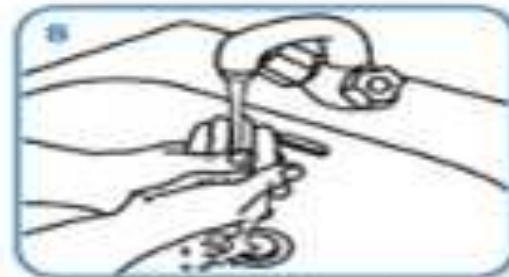
Rinse hands with water