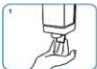
apply enough soap to cover all hand surfaces,