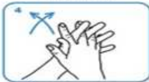
palm to palm with fingers interlaced