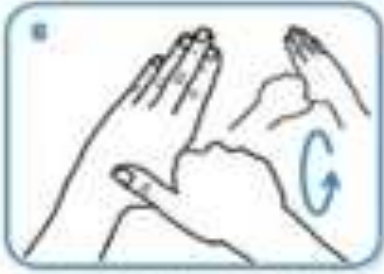
rotational rubbing of left thumb clasped in right palm and vice versa