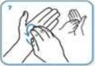
rotational rubbing, backwards and forwards with clasped fingers of right hand in left palm and vice versa..