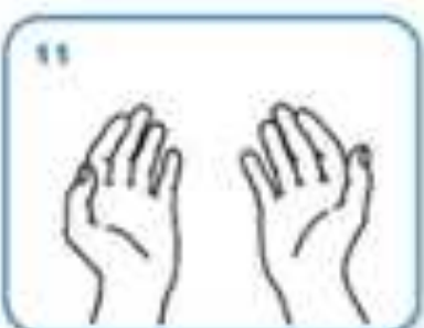
...and your hands are safe.

Videos with informations on how to properly wash your hands. (VÍdeos com informações sobre a maneira correta de lavar as mãos.)