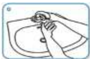
Wet hands with water

1. Baseado nas imagens e informações acima descreva cada uma delas conforme o seu entendimento.