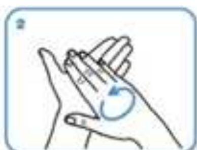
Rub hands palm to palm