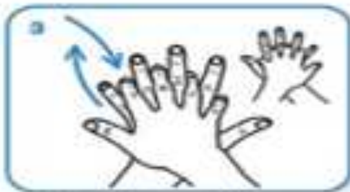
right palm over left dorsum with interlaced fingers and vice versa