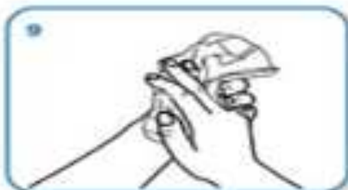
dry thoroughly with a single use towel