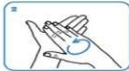
Rub hands palm to palm